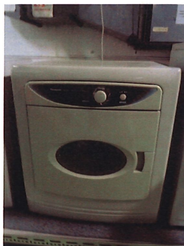
23. 乾衣機*6 台