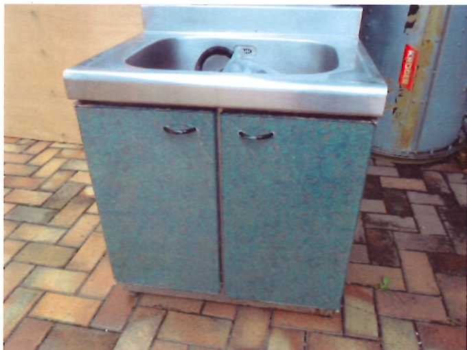
7. 洗手槽*3 個