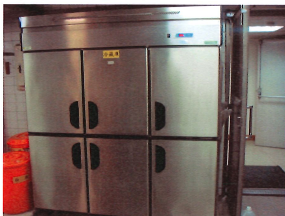
10. 電氣冰櫃*1 台