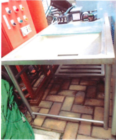
17. 洗手槽*3 個(現勘)