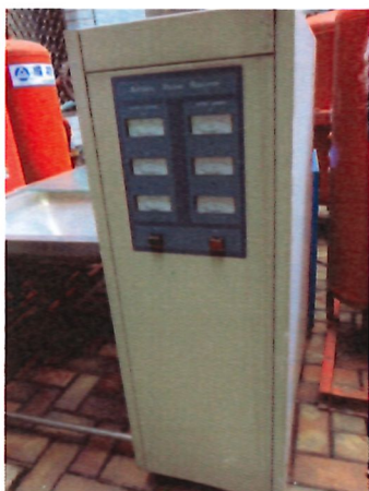
9. 穩壓器*1 台