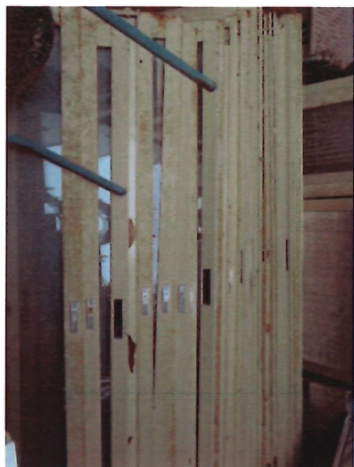
11. 鋁門*1 批(現勘)