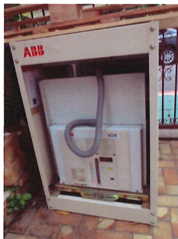
8. 真空斷路器*1 個