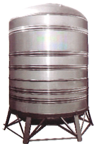
25. 水塔*1 個