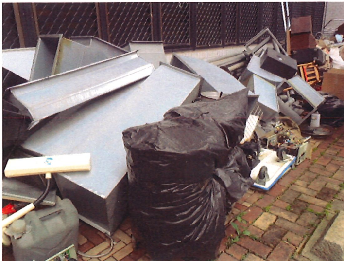
13. 一般金屬*1 批(現勘)