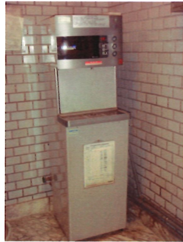
18. 飲水機*8 台