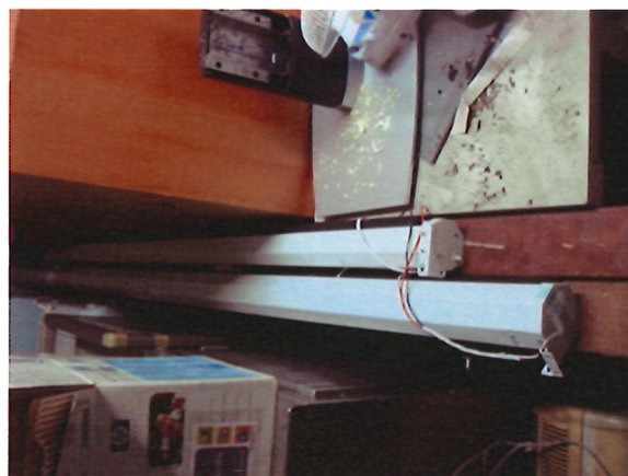
26. 投影機布幕*1 支