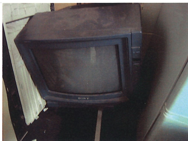
22. 小電視機*2 台