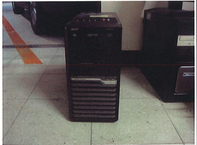
14. 個人電腦*3 台