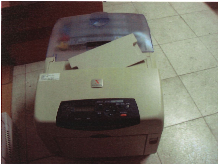
19. 印表機*4 台